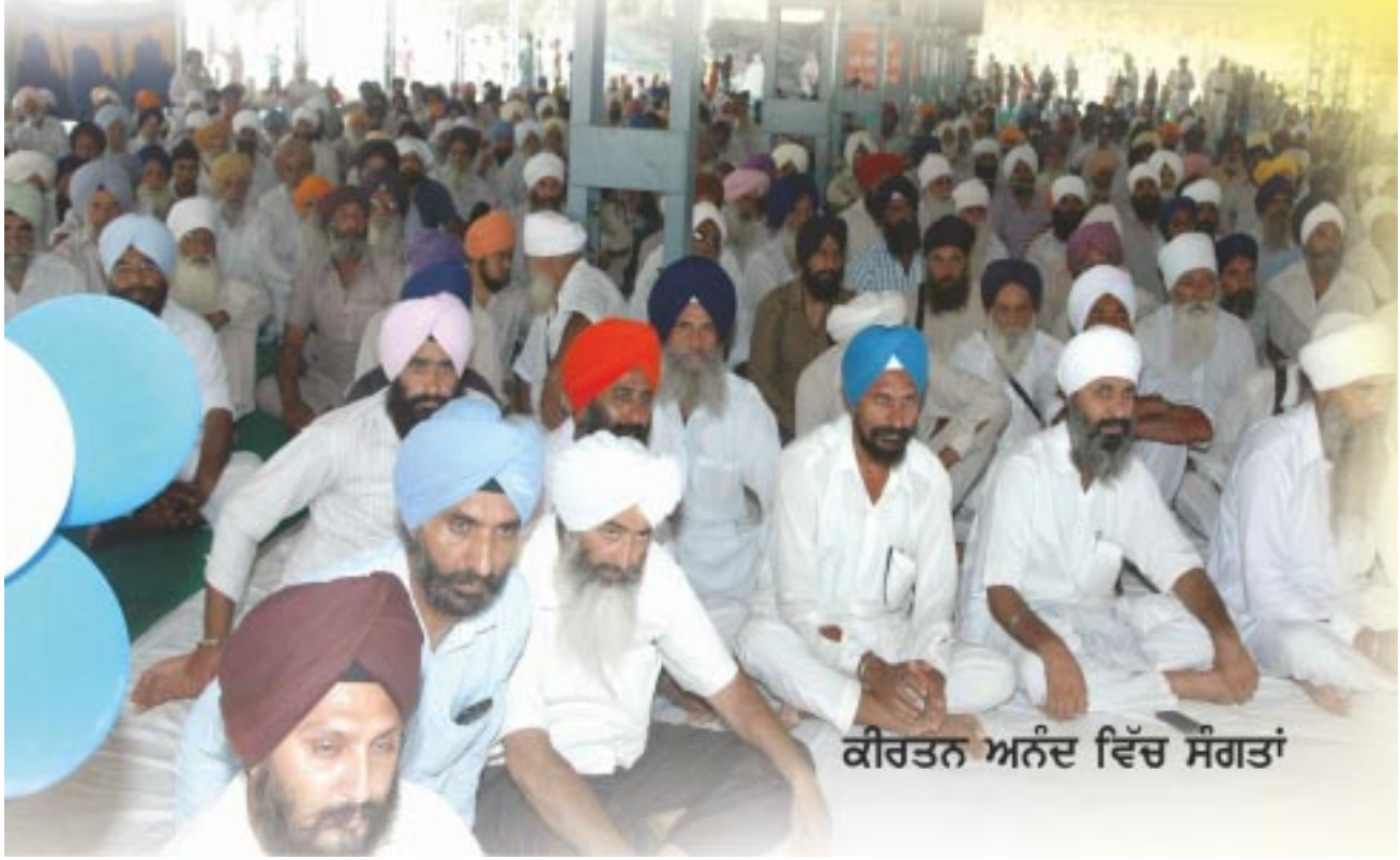
ਕੀਰਤਨ ਅਨੰਦ ਵਿੱਚ ਸੰਗਤਾਂ

ਜੀ ਕਿੰਨਾਂ ਪਿਆਰ ਕਰਦੇ ਬੰਦਿਆਂ ਨਾਲ, ਬੀਬੀਆਂ ਨਾਲ, ਸੰਗਤ ਨਾਲ। ਕਈ-ਕਈ ਕਿਲੋਮੀਟਰ ਪੈਦਲ ਜਾਣਾ ਪੈਂਦਾ ਸੀ, ਰਸਤੇ ਨਹੀਂ ਸਨ। ਪਹਿਲਾਂ ਟਰੈਕਟਰ ਆਪ ਮਹਾਂਪੁਰਸ਼ ਚਲਾਇਆ ਕਰਦੇ, ਹਿੰਦੋਸਤਾਨ ਟਰੈਕਟਰ ਹੁੰਦਾ। ਫੇਰ ਜੱਕਾ ਲਿਆ, ਫੇਰ ਕਾਰ ਲਈ। ਪਹਿਲਾਂ ਮਹਾਂਪੁਰਸ਼ ਆਪ ਟਰੈਕਟਰ ਟਰਾਲੀ ਲੈ ਕੇ ਜਾਇਆ ਕਰਦੇ ਸੀ। ਕਾਰ ਪਿੱਛੇ ਖੜ੍ਹੀ ਕਰ ਦੇਈ, ਪੰਜ-ਪੰਜ, ਸੱਤ-ਸੱਤ ਕਿਲੋਮੀਟਰ ਪੈਦਲ ਖੇਤਾਂ ਦੇ ਬੰਨ੍ਹਿਆਂ 'ਤੇ ਝੁਰੇ ਜਾਣਾ। ਕਿੰਨੀ ਵੱਡੀ ਖੇਚਲ ਸੀ। ਦੇਕ ਦੀ ਰਸਦ ਘਰੇਂ ਲੈ ਕੇ ਜਾਣੀ। ਕਿਸੇ ਨੂੰ ਖੇਚਲ ਨਾ ਪਵੇ। ਕਿਸੇ ਭਰ੍ਹਾਂ ਦੀ ਕੋਈ ਖੇਚਲ ਨਹੀਂ, ਕੋਈ ਲਾਊਡ ਸਪੀਕਰ ਨਹੀਂ, ਕੋਈ ਸਾਮਿਆਨਾ ਨਹੀਂ। ਯੂ.ਪੀ ਦੇ ਵਿਚ ਘਰ-ਘਰ ਜਾ ਕੇ ਆਪ ਜੀਆਂ ਨੇ ਪੁਚਾਰ ਕੀਤਾ ਹੈ। ਸੰਤ 1973 ਦੇ ਵਿਚ ਜਿਸ ਵੇਲੇ ਰਾਤਾ ਸਾਹਿਬ ਵਾਲੇ ਮਹਾਂਪੁਰਸ਼ਾਂ ਨੂੰ ਤਰਾਈ ਏਰੀਏ ਵਿਚ ਲੈ ਕੇ ਗਏ। ਮੁਰਾਦਾਬਾਦ ਤੱਕ ਤਾਂ ਜਾਂਦੇ ਸਨ, ਸੰਨ 1973 ਵਿਚ ਪਹਿਲੀ ਵਾਰ ਰਾਤਾ