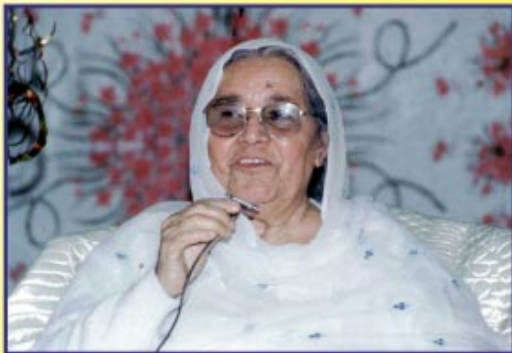
ਸੱਚਖੰਡਵਾਸੀ ਸਤਿਕਾਰਯੋਗ ਸੰਤ ਮਾਤਾ ਜੀ ਬਚਨ ਕਰਦੇ ਹੋਏ-ਇੱਕ ਅਭੁੱਲ ਯਾਦ

ਮਹਾਂਪੁਰਸ਼ ਕਹਿੰਦੇ, ਪੁਰੋਖਿਆਂ! ਫੇਰ ਸਾਹ ਕਿਵੇਂ ਬਲਦਾਂ ਨੂੰ ਦਿਵਾਉਂਦਾ ਸੀ। ਕਹਿੰਦੇ, ਜੀ ਮੈਂ ਗਾਧੀ ਦੇ ਨਾਲ ਗੱਡਾ ਲਾ ਲੈਂਦਾ ਸੀ। ਕਹਿੰਦੇ, ਫੇਰ ਬੜੀ ਖੇਚਲ ਤੈਨੂੰ ਕਰਨੀ ਬਾਅਦ ਇਹ ਕੁੱਤਾ ਇਹਦੀ ਆਵਾਜ਼ ਆਏ ਕੀ। ਹੁਣ ਜਦੋਂ ਉਲਥਾ ਕਰਨਾ ਕਰਨ ਵਾਲੇ ਨੇ ਕੁੱਤੇ ਦਿਤਾ। ਉਹਨੂੰ ਕੀ ਦਾ ਕੁੱਤਾ ਕੀ ਹੁੰਦਾ ਕਿਹਾ ਕਿ dog dog ਸਾਰੀ ਬੋਲਿਆ ਹੀ ਨਾ ਕਿਉਂਕਿ ਉਹਨੂੰ ਗੁਰਮੁਖੀ ਆਵੇ, ਨਾਲ ਪਤਾ ਹੋਵੇ। ਅੰਗ੍ਰੇਜ਼ੀ ਮੈਕੈਡੀਅਮ ਪੜ੍ਹਦੇ ਨੇ ਜਿੱਥੇ ਪੜ੍ਹਾਈ ਜਾਂਦੀ। ਪਰ ਬੋਲੀ ਤੋਂ ਦੂਰ ਚਲੇ