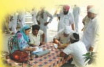
ਨਿਹਾਨ ਭੋਜ ਨਿਰਦਾਸ਼ਾ ਪੇਸ਼ੀ ਵਿਖੇ ਯੂਠ ਵਾਲੇ ਭੋਜ ਖੋਲ੍ਹਣ 60 ਬੇਸ਼ਰੀ ਯੂਠ ਵਾਲੇ ਭੋਜੀਆਂ।