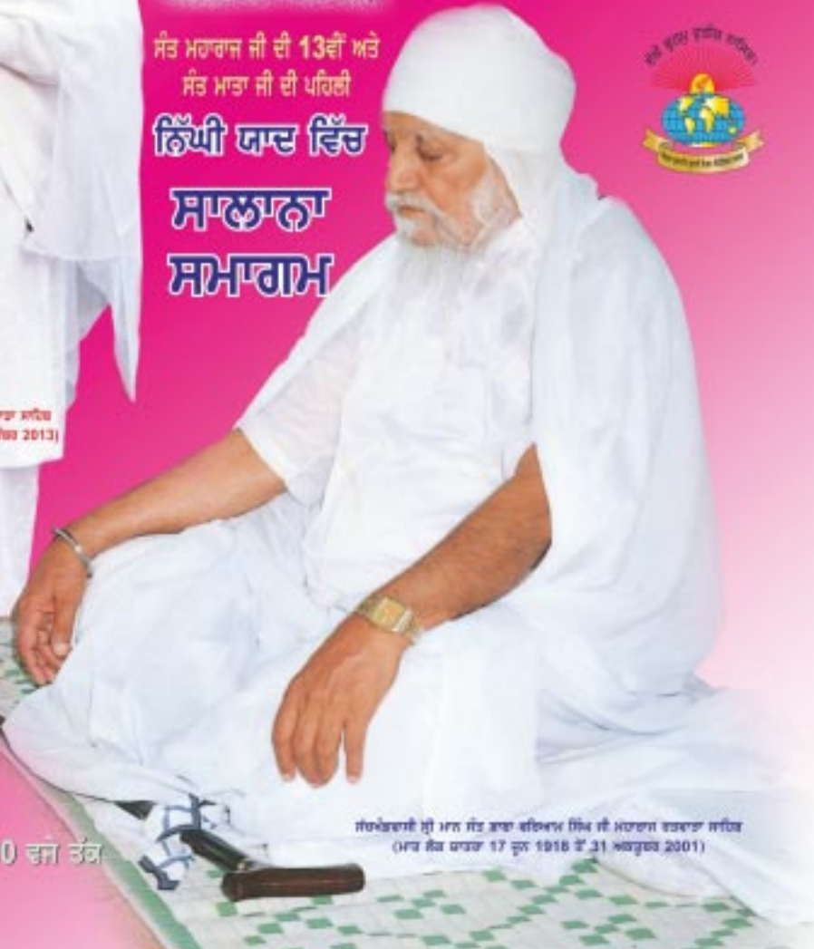
ਸੰਪਾਦਕਵਾਲੀ ਸ੍ਰੀ ਮਨ ਸੰਤ ਭਾਬਾ ਬਲਿਕਮ ਸਿੰਘ ਜੀ ਮਹਾਰਾਜ ਕਰਵਾਰਾ ਲਲਿਤ (ਮਾਤਾ ਸੰਤ ਚਾਚਾ 17 ਜੂਨ 1916 ਤੋਂ 31 ਅਕਤੂਬਰ 2001)