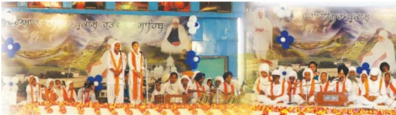
ਸਤਿਕਾਰਯੋਗ ਮਾਤਾ ਜੀ ਦੇ ਜਨਮ ਦਿਹਾੜੇ ਸਮਾਗਮ ਸਮੇਂ ਰਤਵਾੜਾ ਸਾਹਿਬ ਦੇ ਸਕੂਲ ਦੇ ਬੱਚੇ ਕੀਰਤਨ ਕਰਦੇ ਹੋਏ।